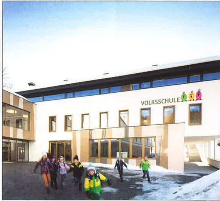
Der moderne Neubau...

Der Unterricht fand damals im Kaplanhaus, wie auch im Rathaus und der "Stuckhütte" statt. Am 28. Februar 1880 kam es zur Grundsteinlegung eines Gemeindeschulhauses am derzeitigen Standort. Im Jahr 1900 wurde die bis zum jetzigen Umbau verwendete Turnhalle errichtet, 1907 wurde eine Mädchen-volksschule mit vier Klassenzimmern neben der Pfarrkirche gebaut. Während des Ersten Weltkrieges wurde im "Josefinum" und im "Resch-Haus" auf der Mühlleite unterrichtet, da in den Schulen Soldaten untergebracht waren.