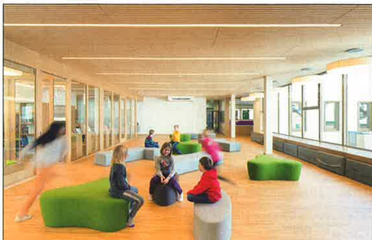
Im Zwischentrakt ist auch eine geräumige Aula sowie eine Bibliothek untergebracht.

und Denkmalschutzes zu schaffen. Ein besonderes Augenmerk wurde auf die kindergerechten Möbel gelegt. Auch wurden überwiegend heimische Unternehmen bei diesem Großprojekt engagiert. Zum Anlass der Fertigstellung bzw. der Einweihung der neuen Volksschule wurde eine gelungene Festschrift erstellt, die ab Freitag, 7. April, 10 Uhr, im Rahmen der feierlichen Eröffnung der Schule, erhältlich ist.