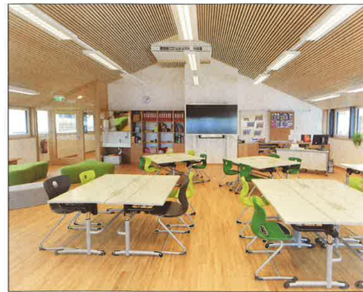
Viel Holz, Licht und Farben sollen das Lernklima angenehm gestalten.