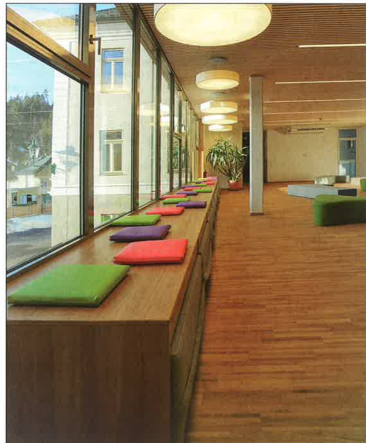
Ein Blick in die lichtdurchflutete und einladende Aula der Volksschule.