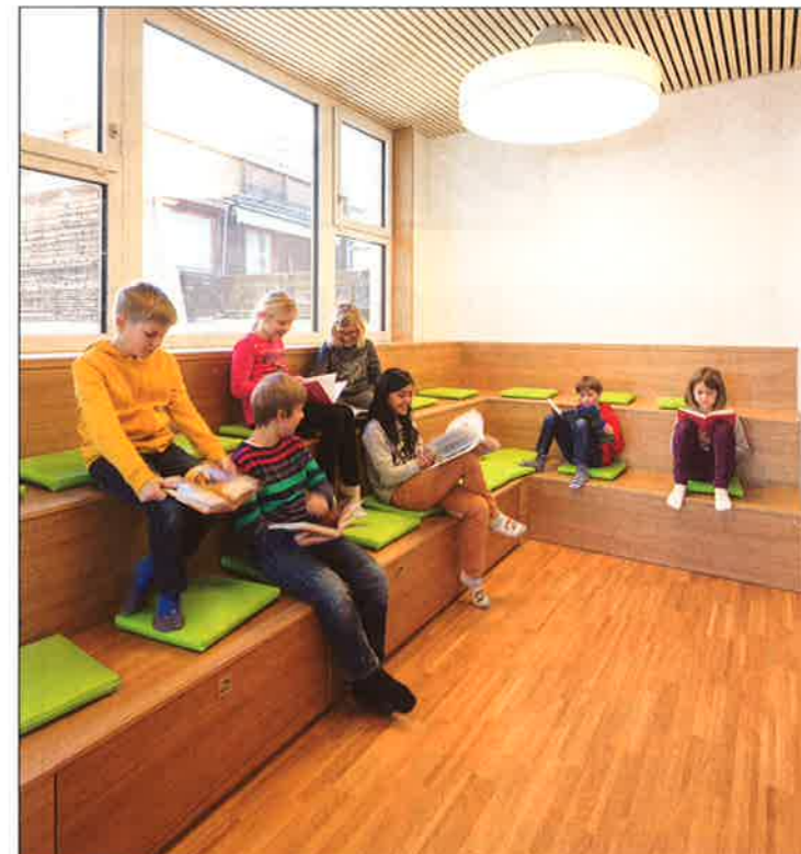
Die sogenannte "Trüffel-Ecke" ist bei den Kindern sehr beliebt - sie wird zur Kommunikation genauso genutzt, wie auch für stille Arbeiten.