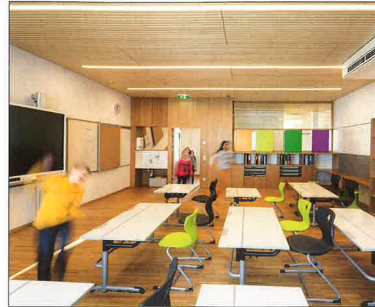
Bei den Klassenzimmern wurde nach neuesten Erkenntnissen für das Wohlbefinden der Schüler gearbeitet.