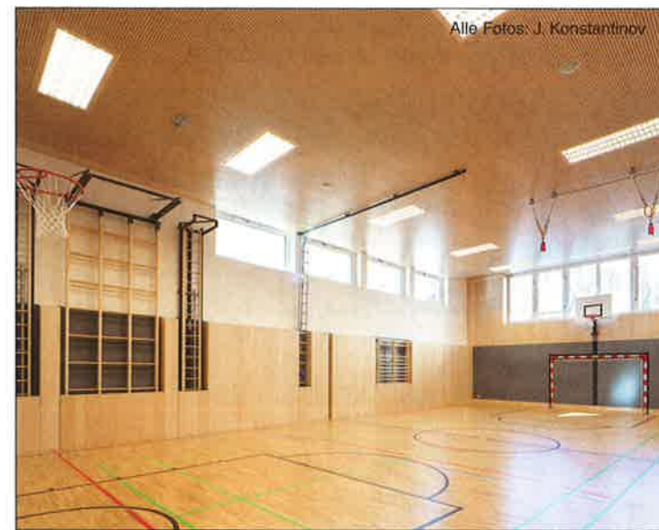
Der Turnsaal punktet durch Funktionalität auf höchstem Niveau.