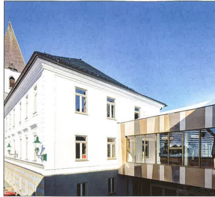
...harmonisiert perfekt mit dem denkmalgeschützten, generalsanierten Altbestand.