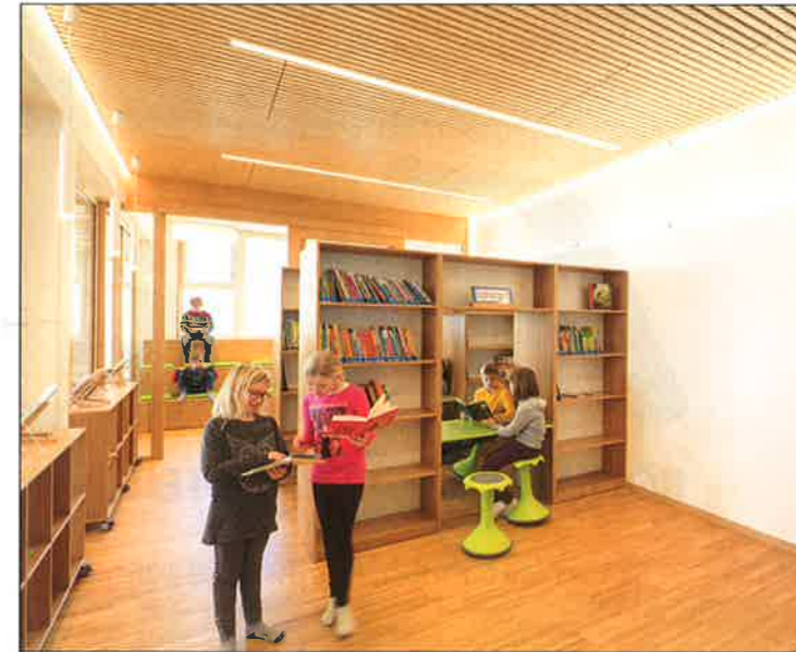
Auch über eine Bibliothek verfügt die neue Schule, die die Kinder dazu einlädt, ihr Wissen zu erweitern.