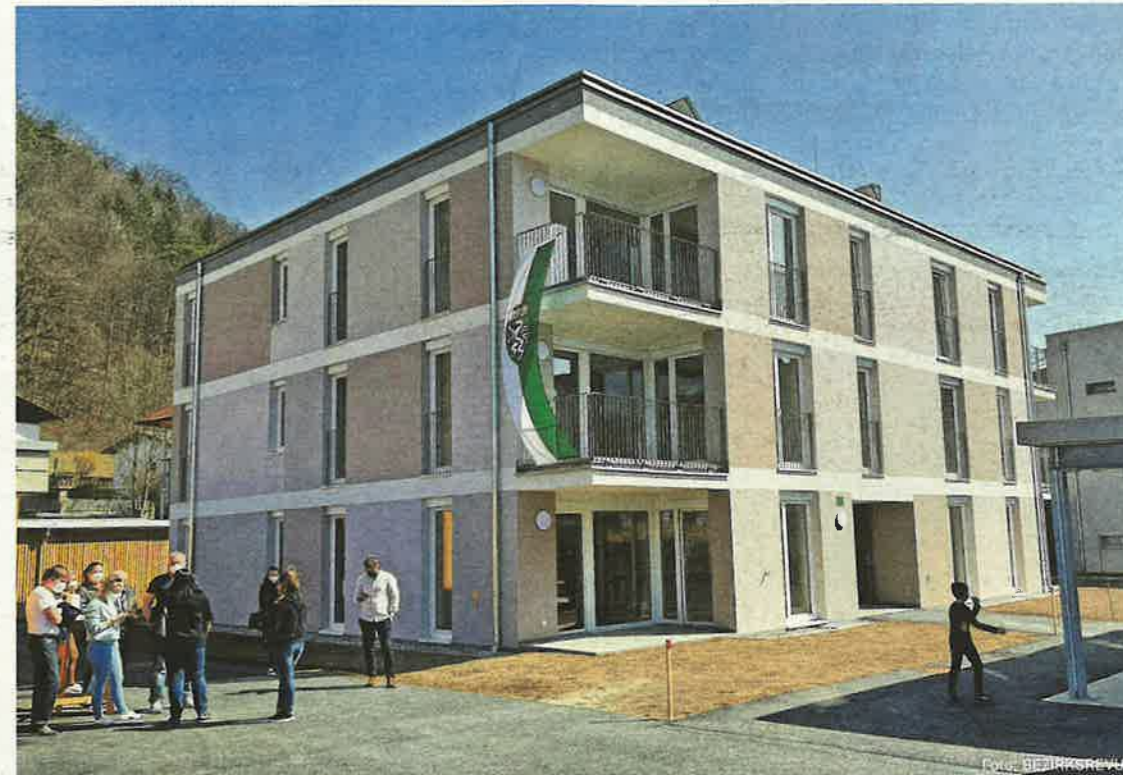
18 Wohnungen, aufgeteilt auf zwei Häuser, wurden vergangenen Freitag übergeben, 57 weitere folgen.

Er lobte die Vorzüge der Region OberGraz mit ihrer kulturellen und landschaftlichen Vielfalt und lud zum Besuch der Sehenswürdigkeiten ein. Dazu gab es – mit