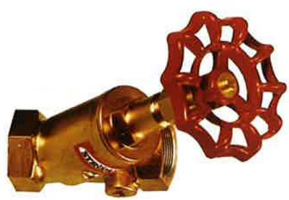
4115A - um 1960