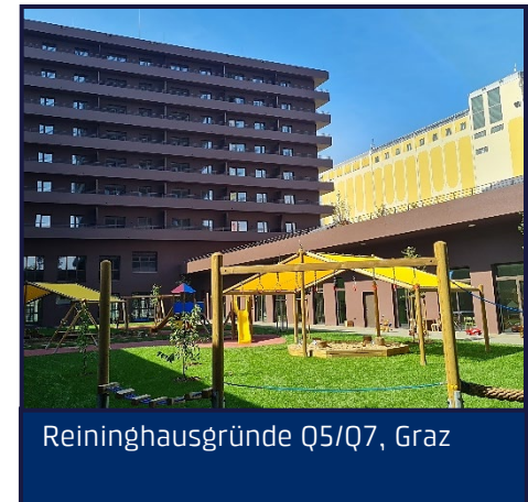
Reinigungshausgründe Q5/Q7, Graz