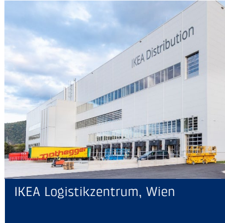
IKEA Logistikzentrum, Wien