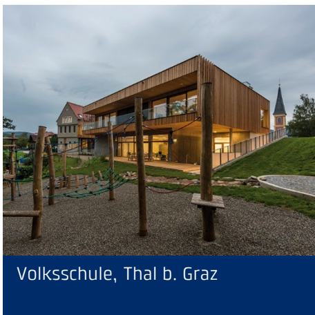
Volksschule, Thal b. Graz