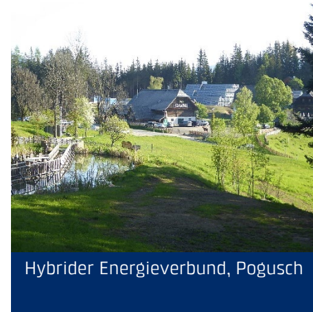
Hybrider Energieverbund, Pogusch