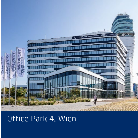
Office Park 4, Wien