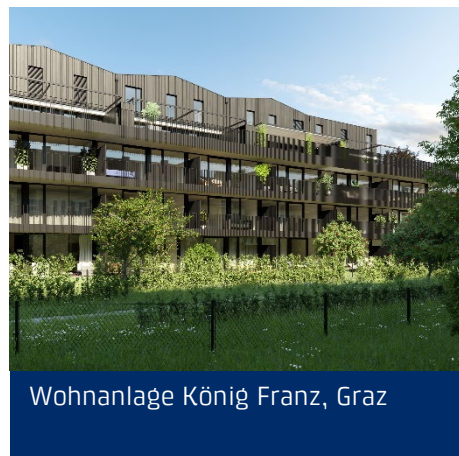
Wohnanlage König Franz, Graz