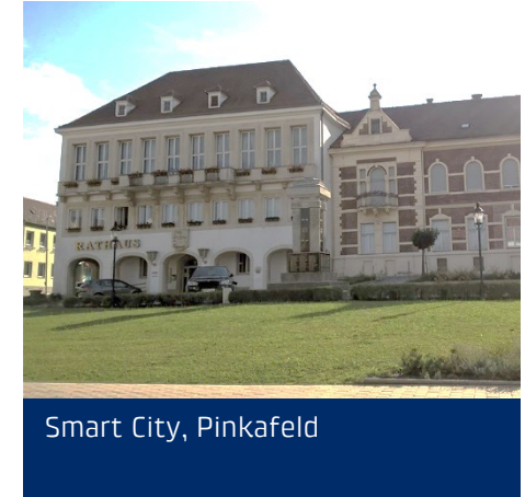
Smart City, Pinkafeld