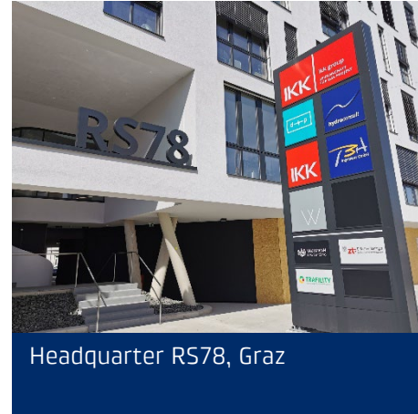
Headquarter RS78, Graz