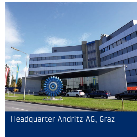
Headquarter Andritz AG, Graz